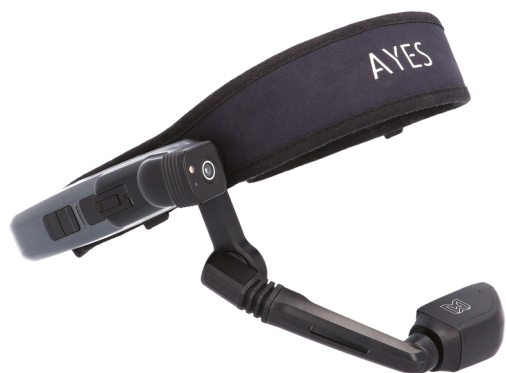
Chytré brýle RealWear Navigator™ 500 jsou světová jednička v oblasti hands-free technologií v průmyslu.

Vzájemná spolupráce AYES a Mondi začala skrze slovenský výrobní závod v Ružomberoku. Tamní vedení hledalo řešení, které zlepší podmínky práce týmu údržby a zvýší efektivitu, rychlost a kvalitu procesů. Našlo jej v podobě chytrých brýlí RealWare v kombinaci se softwarem TeamViewer Frontline xAssist a s navazující nadstandardní servisní podporou a poradenstvím technického týmu AYES. Díky této pozitivní zkušenosti se vybrané řešení implementuje jako globální projekt do všech výrobních závodů celého holdingu.